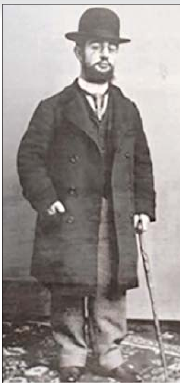
Henri de Toulouse-Latrech.

Toulouse-Latrech var en av sin tids viktigaste och mest nytänkande affischkonstnärer och målade med exceptionell kraft med svarta streck och svepande diagonaler.