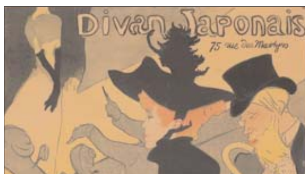
Divan Japonais, 1892-93. Del av affisch gjord av Toulouse. Zimmerli Art Museum at Rutgers University Mew Brunswick, New Jersey, USA.

Det var dock en skada vid tretton års ålder som förändrade Toulouse-Latrechs fysikaliska för alltid. Inom loppet av ett år bröt han båda lårbenen och på grund av detta och en genetisk störning slutade hans ben att växa. Hans torso växte till en vuxen storlek, men inte hans ben. Han blev bara 142 cm.