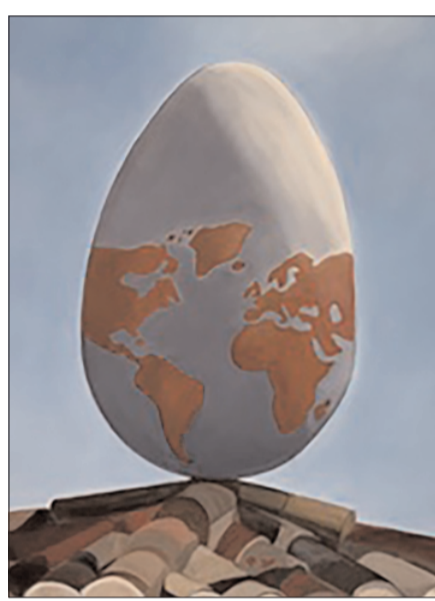
Målning av Elisabeth Hagelberg.

“Jag har alltid varit intresserad av konst, konstnärer och av att måla. Jag älskar även att gå på utställningar och konstmuseum var jag än befunnit mig och jag har alltid närt en dröm att själv få börja måla på allvar”.